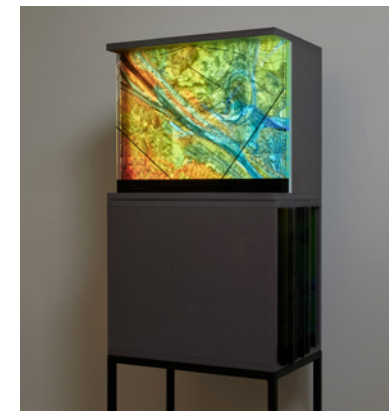
Dynamic Landscape, 2023

Anmeldung/Information für Schulprogramme: +43 732 7070 3614 oder kunstvermittlung@lentos.at Dauer wählbar: 1 Std., 1,5 oder 2 Std. Kosten: € 4, 5 oder 6