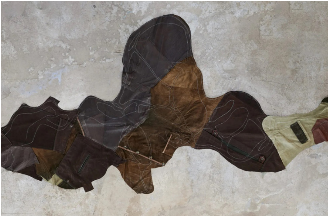
Jagdkarte (Detail), 2023