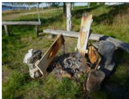
Lachsgrillen in Inari