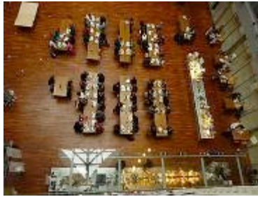
Mensa der Kunstuni